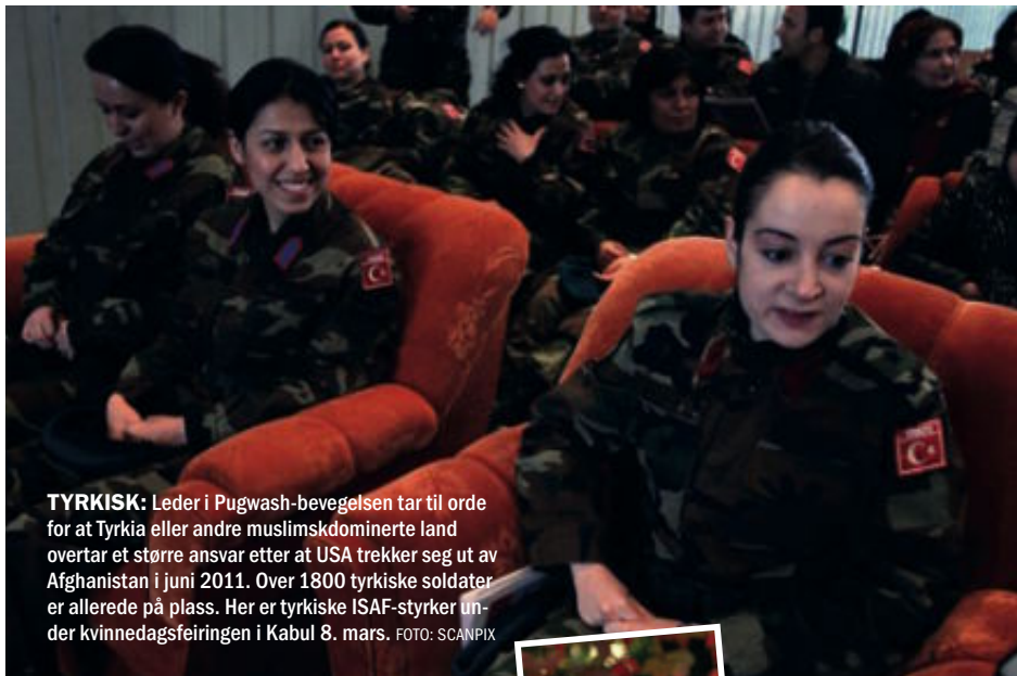
TYRKISK: Leder i Pugwash-bevegelsen tar til orde for at Tyrkia eller andre muslimskdominerte land overtar et større ansvar etter at USA trekker seg ut av Afghanistan i juni 2011. Over 1800 tyrkiske soldater er allerede på plass. Her er tyrkiske ISAF-styrker under kvinnedagsfeiringen i Kabul 8. mars.