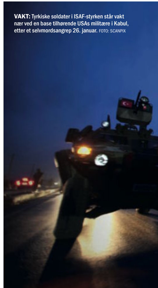
VAKT: Tyrkiske soldater i ISAF-styrken står vakt nær ved en base tilhørende USAs militære i Kabul, etter et selvmordsangrep 26. januar.

Land som ikke har maktinteresser i Afghanistan, og som har en velorganisert stående hær, står øverst på Dorns liste over deltakere i en fredsstyrke. Det kan dreie seg om Tyrkia, Jordan, Tunisia, Malaysia, Indonesia eller Bangladesh. For å lykkes mener Dorn styrken burde ha massiv støtte fra FN's medlemsland, være på rundt 30-40.000 soldater og ha et budsjett på omtrent 30 milliarder