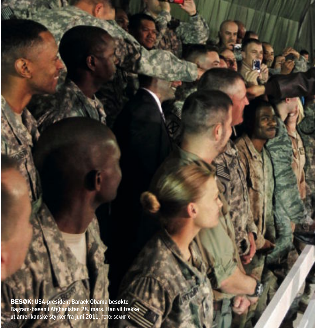
BESØK: USA-president Barack Obama besøkte Bagram-basen i Afghanistan 28. mars. Han vil trekke ut amerikanske styrker fra juni 2011.

Med 1,3 millioner personell i sine væpnede styrker er Tyrkia den nest største militære makten i Nato, kun overgått av USA som har 1,4 millioner. Med en slik kapasitet kunne derfor Tyrkia være godt stilt til å ta over lederrollen etter USA i Afghanistan. Tyrkia har tidligere ledet ISAF to ganger. Det skjedde fra juni 2002 til februar i 2006 og fra